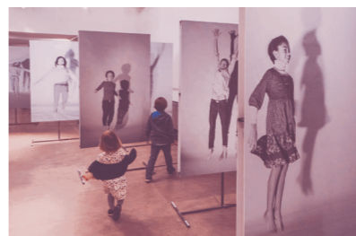
Shiraz work in progress